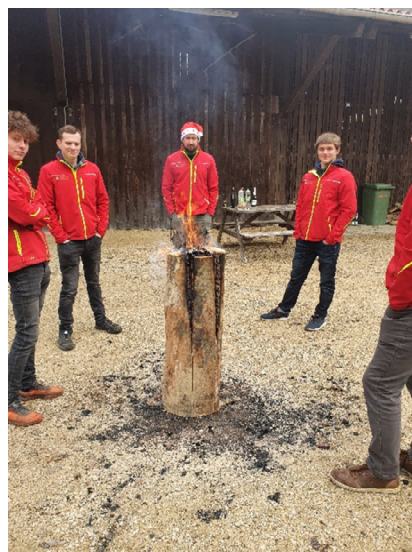
Coroanbedingt hat die Holzerweihnacht 2020 im kleinen Rahmen stattgefunden. Dafür doppelt – jedes Holzerteam getrennt.