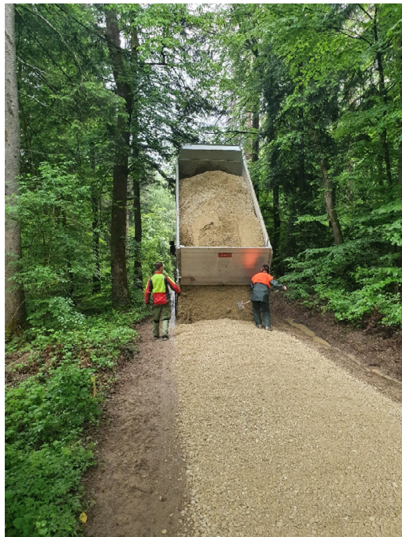
2020 wurden überdurchschnittlich zahlreiche Waldstrassen neu überkiest.

Der Forstbetrieb schliesst im achten Betriebsjahr 2020 mit einem Ertragsüberschuss von CHF 47'598.04 ab. Budgetiert war ein Überschuss von CHF 44'520. Dieser Ertragsüberschuss wird im Eigenkapital gutgeschrieben. Der Umsatz betrug Fr. 2.19 Mio. Ende 2020 betrug das Eigenkapital Fr. 1.84 Mio. Der Betrieb ist für die Zukunft gut gerüstet und kann Investitionen aus eigener Kraft finanzieren. Es wurde 2020 mit nötigen Anschaffungen, Investitionen in die Jungwaldbestände und Infrastruktur (Strassen und Gebäude) kräftig investiert.