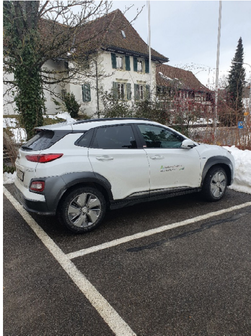
Im Dezember wurde ein voll elektrisches Dienstfahrzeug für den Förster angeschafft.