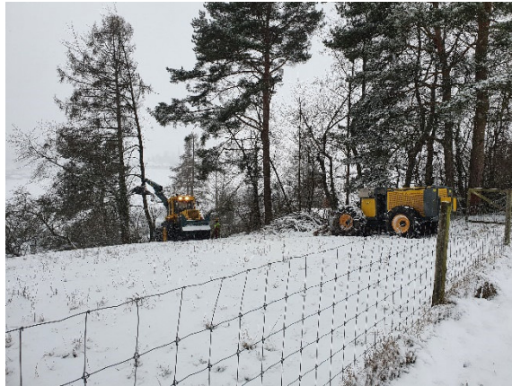
Gartenholzerei unter erschwerten Bedingungen - eine Lieblingsdisziplin unseres Forstteams.

Der Forstbetrieb durfte im Jahr 2020 für Fr. 621'832 Aufträge für Firmen, Private, die Gemeinden und den Kanton ausführen. Damit wurde das Jahresziel übertroffen.