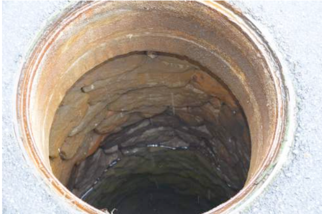
Bei Familie Burkard am Stein 2 ist unter dem Strassenbelag ein Sodbrunnen erhalten.